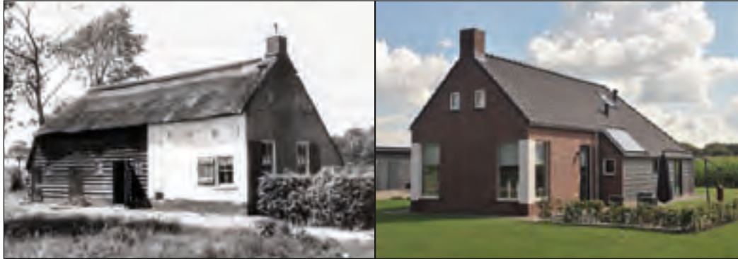
AFBEELDING 15 en 16

Historische kolonistenwoning (links) en rechts een nieuwe Koloniewoning van de Toekomst, een duurzaam initiatief.