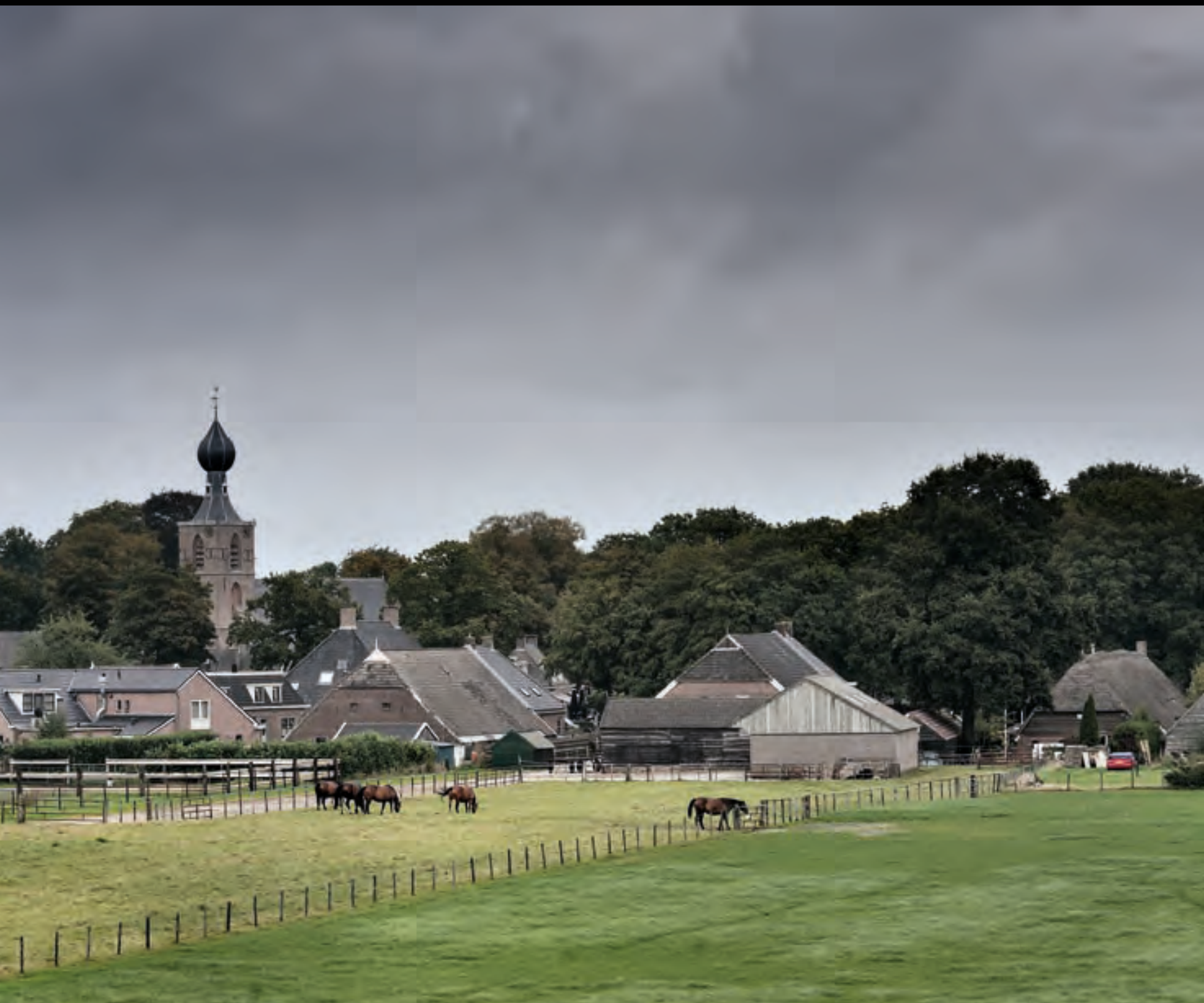
Zicht op Dwingelo vanaf de Poolweg. Links is de Sint Nicolaaskerk te zien.