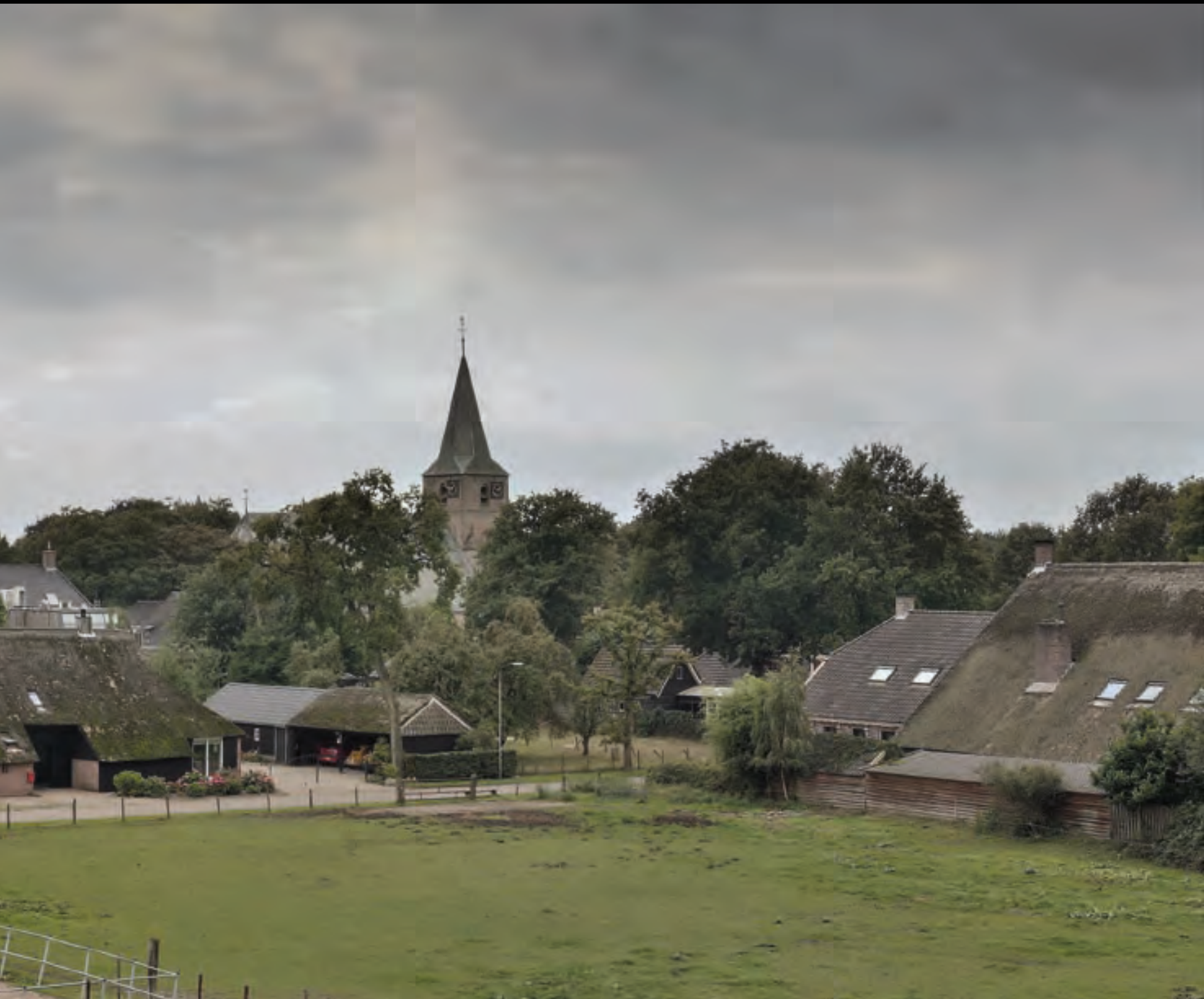
Zicht op de kerktoren van Diever vanaf de Ten Darperweg.